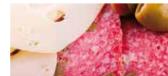
salumi e formaggi